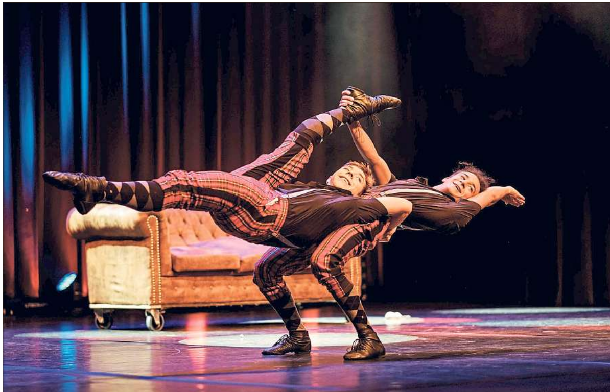
Das Duo „Kraoul“ begeisterte mit Artistik und Clownerie das Publikum am Freitagabend im Warendorfer Theater am Wall.