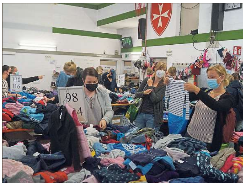
Der Markt war gut besucht und dank der Waren von 100 Verkäufern auch bestens bestückt.